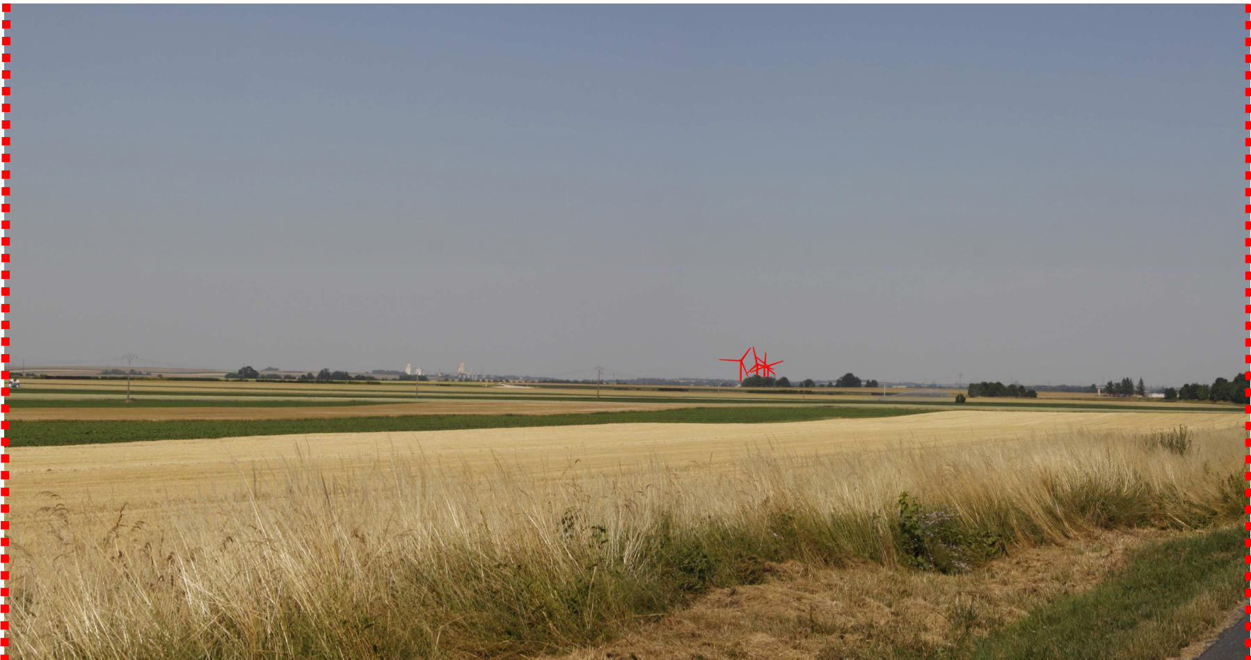
Photomontage d'interprétation recadré à 60°