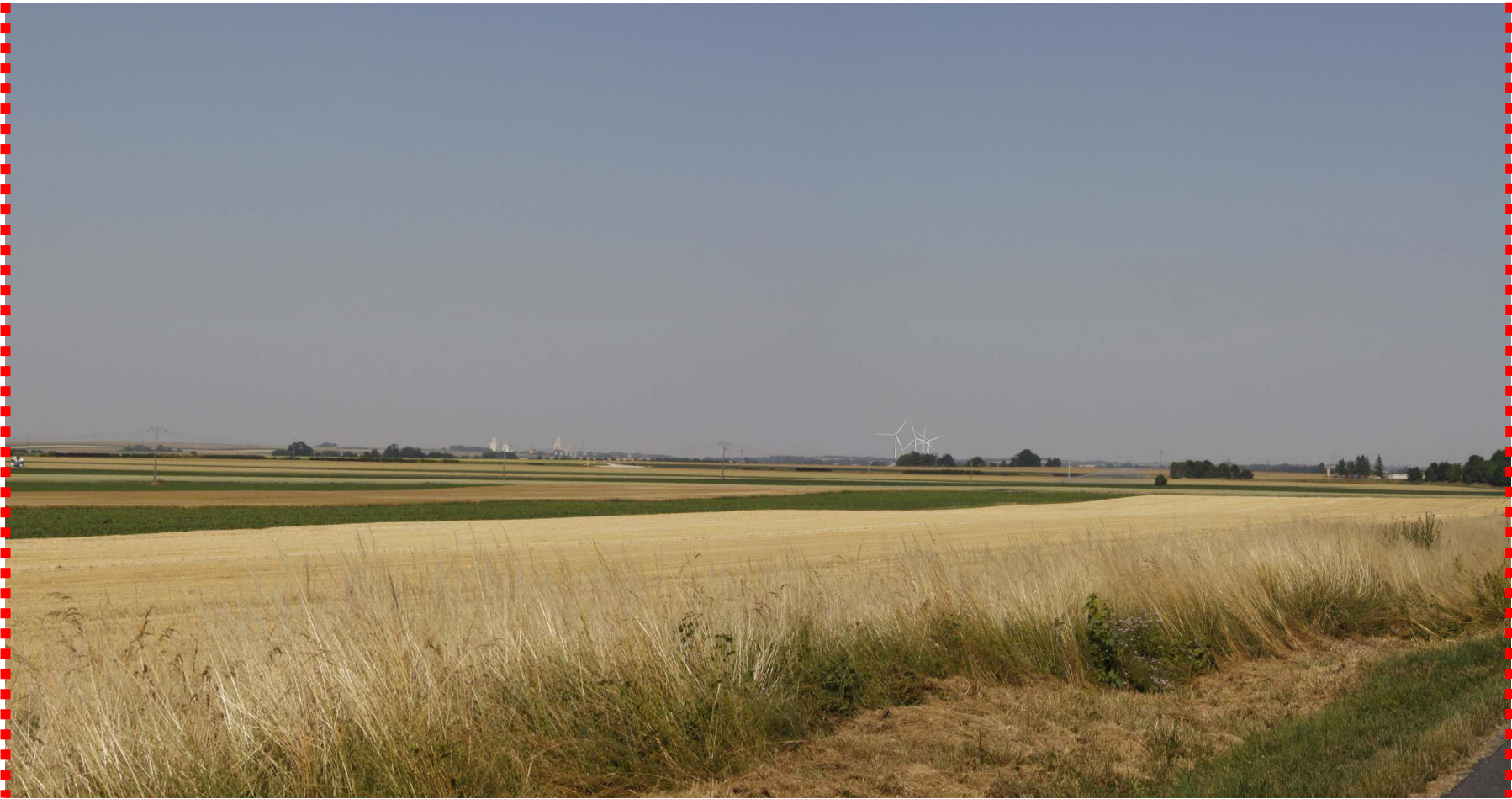
Photomontage recadré à 60°